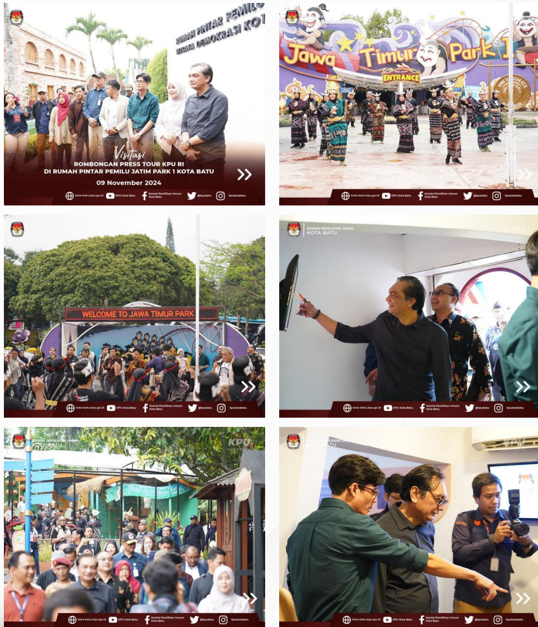
Gambar 1: Foto Kunjungan dan Monitoring Pimpinan KPU RI ke RPP Nasional Jatim Park 1

Kunjungan ini, selain sebagai mekanisme mengecek sejauh mana progres RPP Nasional yang ada di KPU Kota Batu juga sebagai bagian memberikan pengetahuan teknis dan empiris kepada insan pers yang mengikuti agenda Press Tour.