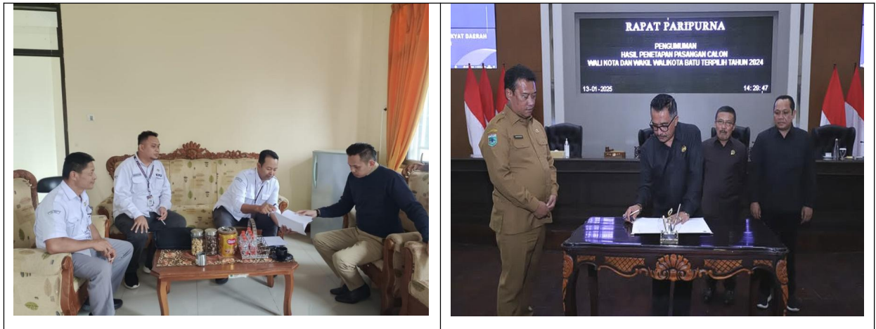
Gambar 2: Koordinasi KPU Kota Batu Bersama Sekretariat DPRD Kota Batu