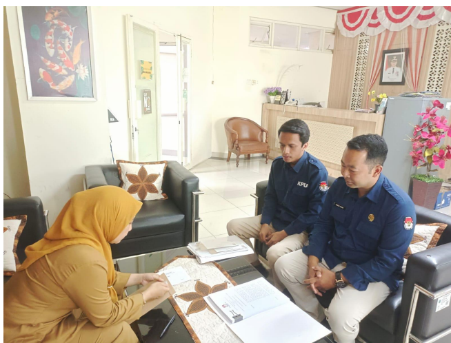
Gambar 1: Koordinasi KPU Kota Batu Bersama Bakesbangpol

Kedua, sebelum dilakukan Rapat Paripurna Pengumuman Hasil Penetapan Pasangan Calon Wali Kota dan Wakil Wali Kota Batu Terpilih Tahun 2024 oleh DPRD Kota Batu, KPU Kota Batu melakukan koordinasi dengan Sekretariat DPRD Kota Batu guna memastikan kelengkapan dokumen yang dibutuhkan. Beberapa dokumen, seperti hasil perolehan suara, penetapan paslon terpilih, dan lainnya diserahkan kepada sekretariat dewan. Pertemuan berjalan lancar dan seluruh dokumen terpenuhi dengan baik.