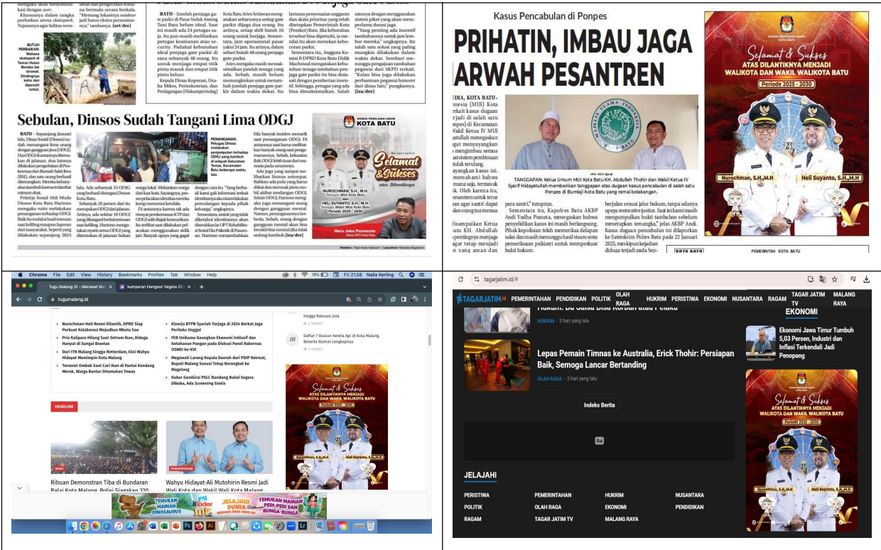
Gambar 5: Publikasi Ucapan Selamat Pelantikan di Media Massa

Terakhir, pada rentang periode Januari-Maret, KPU Kota Batu melaksanakan penyusunan laporan evaluasi Pilkada Tahun 2024. Dalam proses penyusunan, KPU Kota Batu melibatkan pihak eksternal guna menerima masukan kritis dan konstruktif