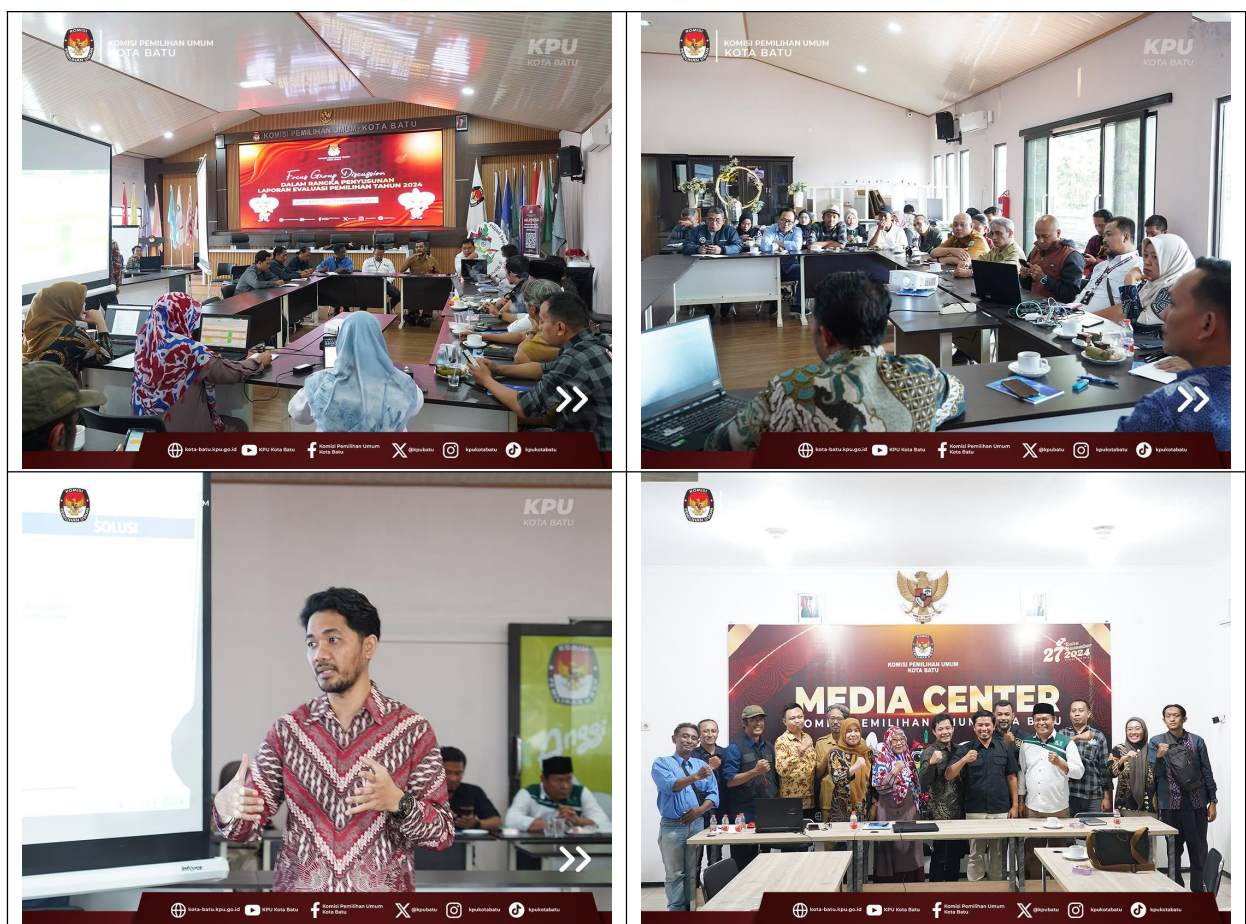
Gambar 6: Kegiatan FGD Penyusunan Laporan Evaluasi Pilkada 2024 Sebagai Bagian Koordinasi Stakeholder

Melalui FGD, KPU Kota Batu berupaya menerima masukan dari berbagai pihak untuk mendukung terciptanya pemilu yang berkualitas dan dapat diterima oleh semua lapisan masyarakat. Sejalan dengan maksud itu, FGD tersebut juga menjadi forum untuk mendiskusikan berbagai isu yang dihadapi selama pelaksanaan pemilihan, seperti kendala dalam proses penyusunan daftar pemilih, sosialisasi dan kampanye, tata kelola logistik, pemungutan suara, penyebaran informasi, hingga peran media dalam mengawasi proses pemilu.